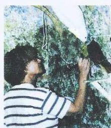
Stages A & B